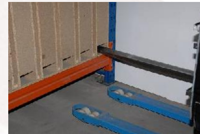
müheloses Erreichen der äußeren Regalfächer - auch an Wänden