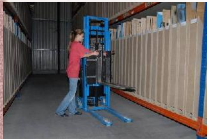
spielend leichtes Verstellen der Gabel - auch unter Volllast