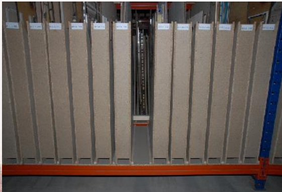
Kassetten für Werkzeugsätze