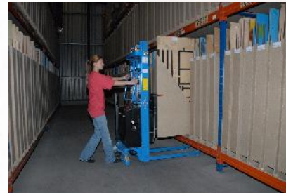
einfaches Herausziehen der Kassette mit dem kompletten Werkzeugsatz