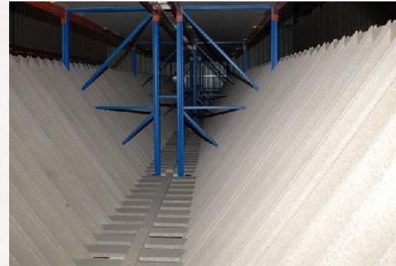
Tiefenanschlag für Kassetten