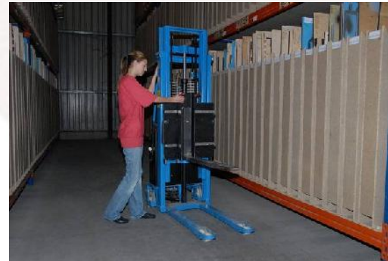
Handlinggerät mit Spezialaufnahme