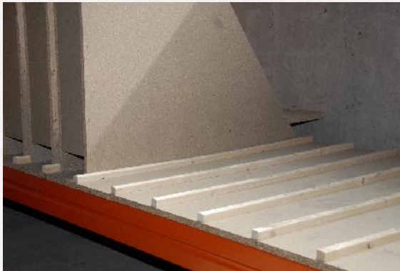
Bodenplatte mit Rasterleisten

Das System besteht aus folgenden Komponenten: